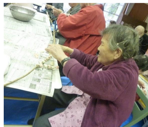
紅白のお餅を枝につけていきます。これが意外と難しい！