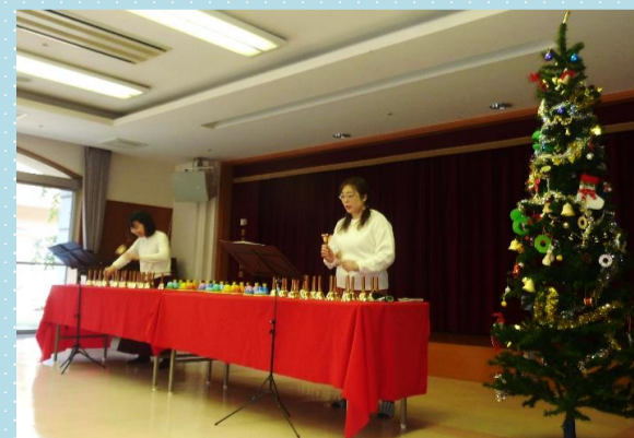
12月18日、クリンゲルのお二人によるハンドベル演奏会を行いました。ベルの音色がクリスマスソングにマッチして、素敵な雰囲気になりました。