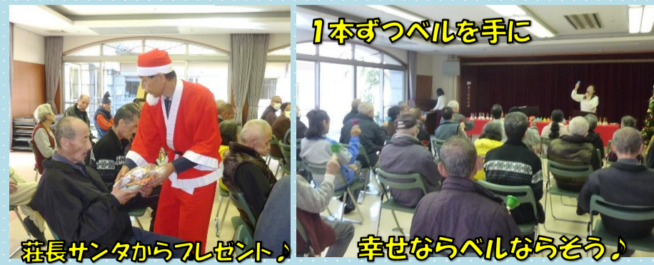
荘長サンタからプレゼント♪