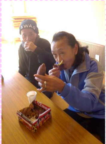
今シーズン2回目の焼きいも会!!小粒でも愛情たっぷり育てたさつまいもの味は格別でした!!