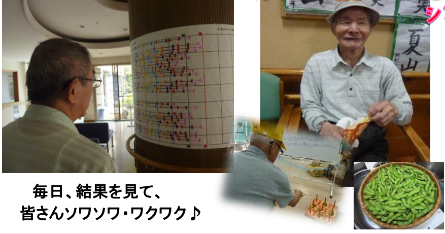
毎日、結果を見て、皆さんソワソワ・ワクワク♪