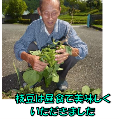
枝豆は昼食で美味しくいただきました